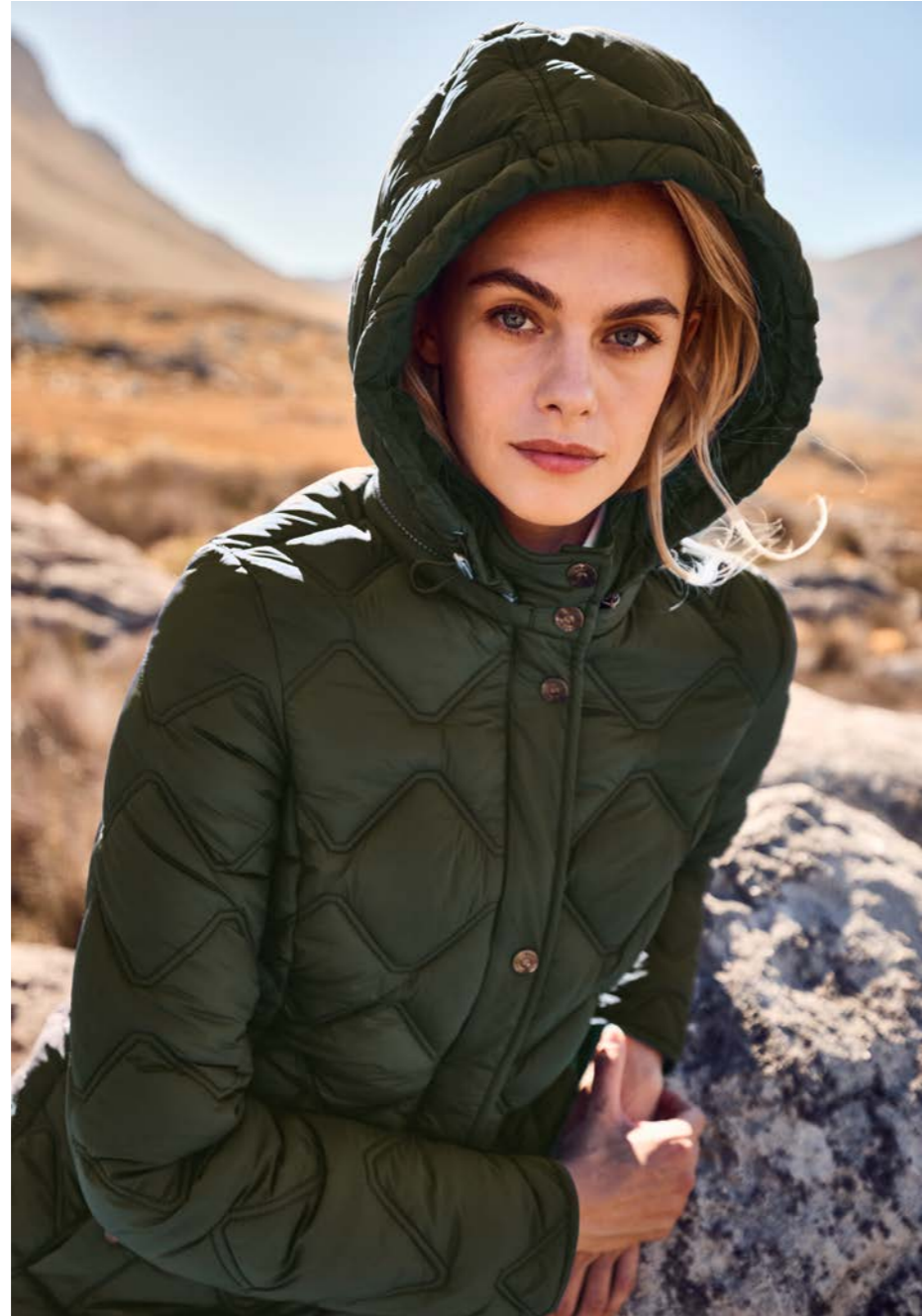
LIGHTWEIGHT QUILTED LONG JACKET 82542N 9228