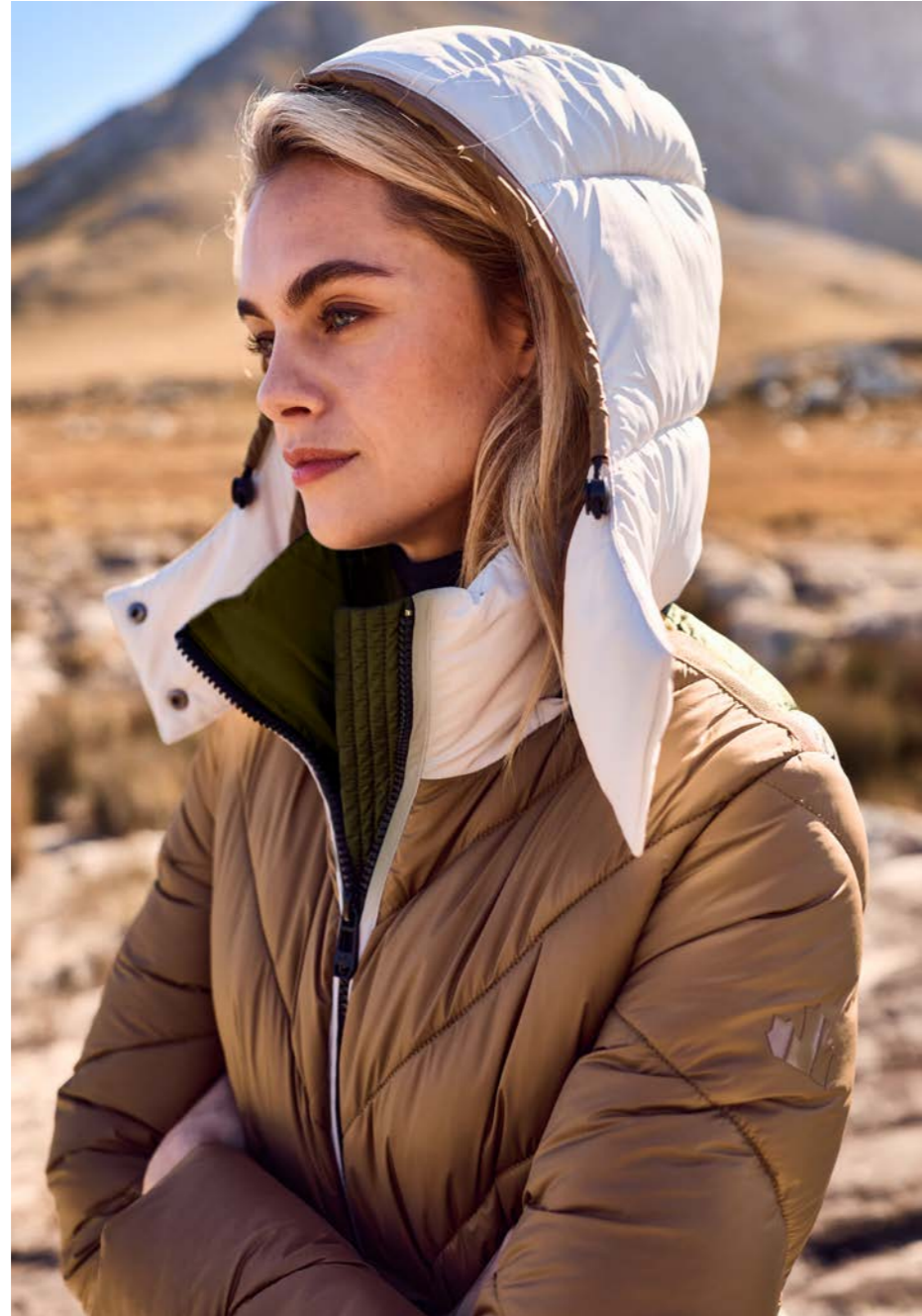
QUILTED COLOURBLOCKING PARKA 82548N 9228