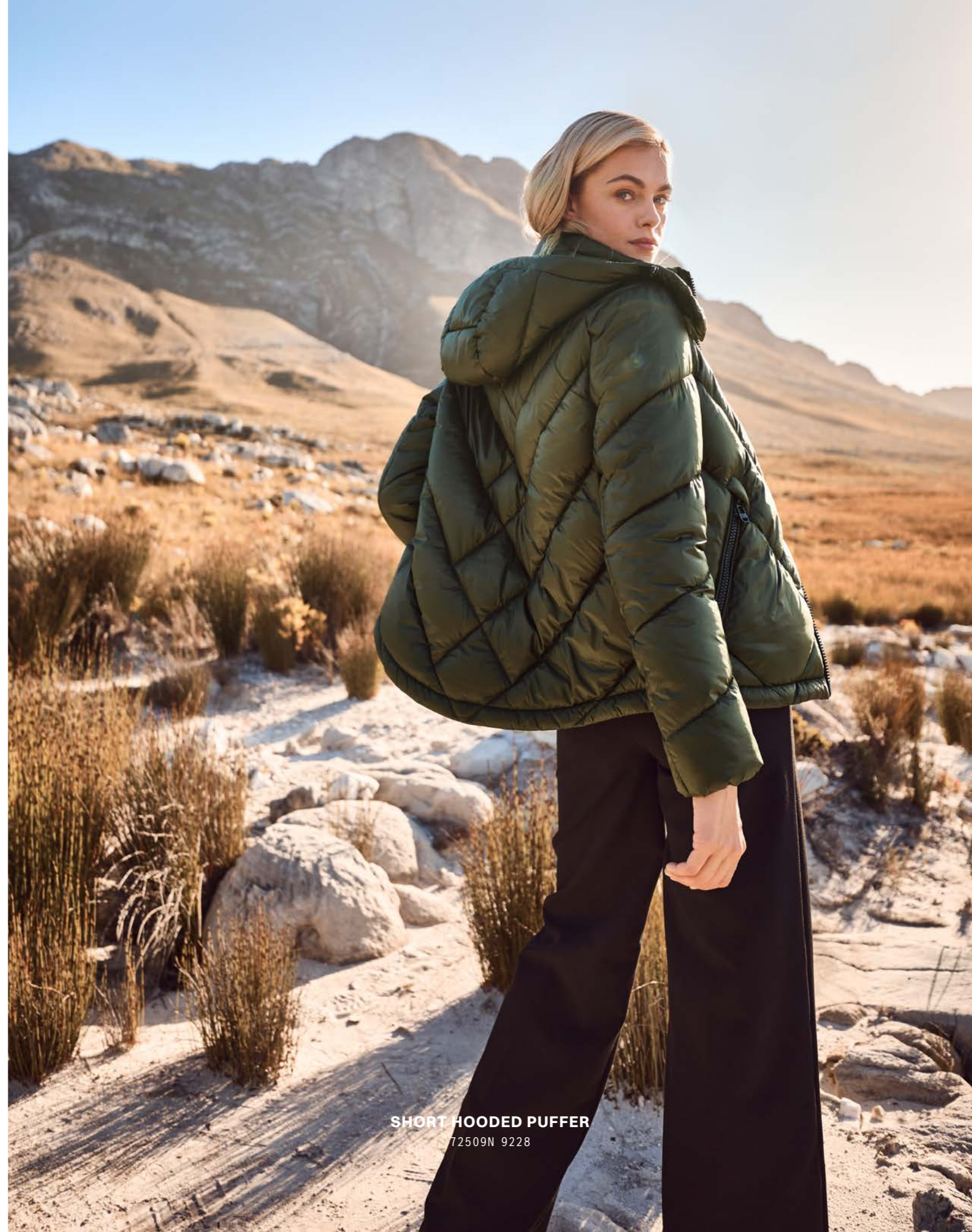
SHORT HOODED PUFFER 72509N 9228