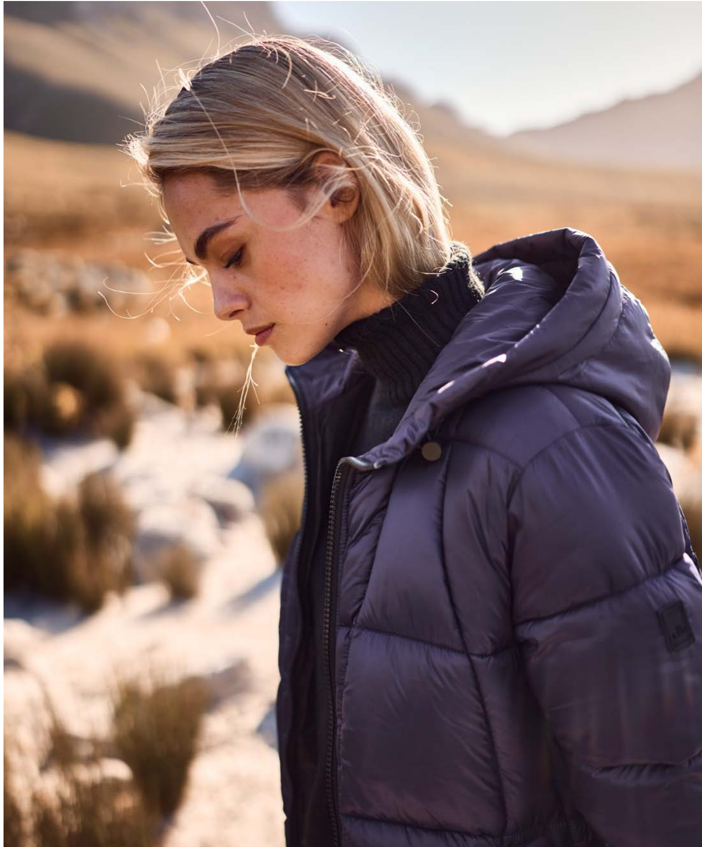
LONG WAVE QUILTED PARKA 82541N 9228